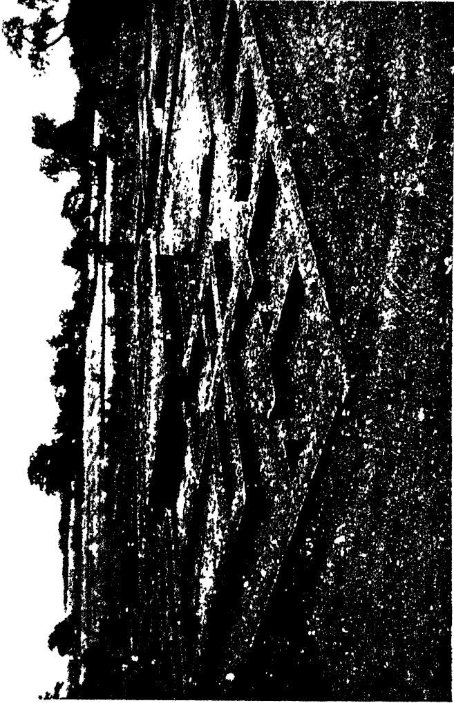
जैतवन : संघाराम 'जी'